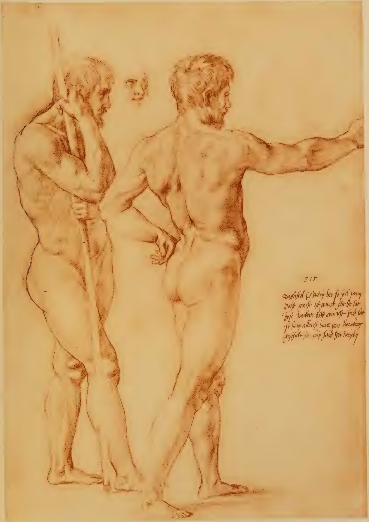
Etude pour des guerriers de la bataille d'Ostie